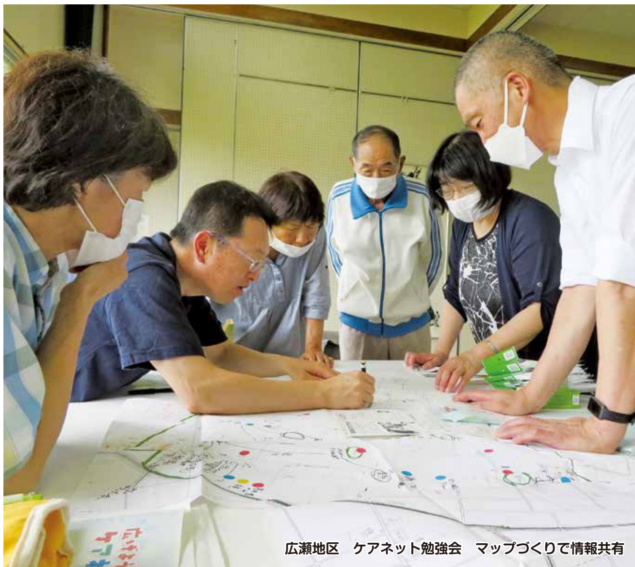
広瀬地区 ケアネット勉強会 マップづくりで情報共有