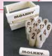
レクリエーション機材 「モルック」