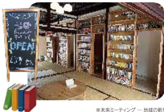
※未来ミーティング…地域の新たな魅力を発見し、未来について住民が考える会議

「新たな地域のにぎわいの拠点」として、子どもと大人がつながり、多目的に活用できる居場所になっています。5月からの本格オープンに向けてさらなる盛り上がりを見せています。