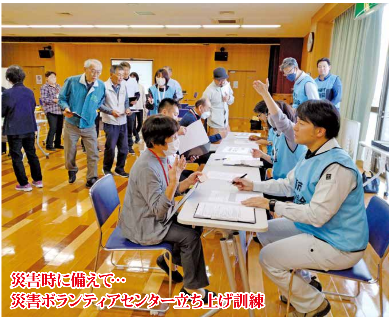
災害時に備えて.. 災害ボランティアセンター立ち上げ訓練