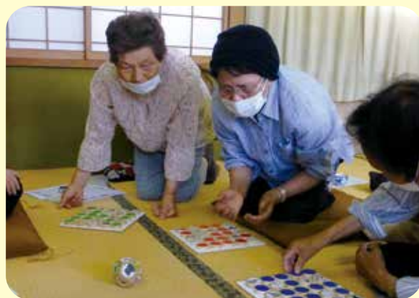
上原かたらいサロン ～ みんな真剣！十二支ビンゴゲーム ～