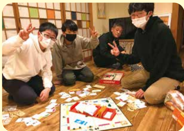
いたずらーず ～ ゲーム合戦中 ～