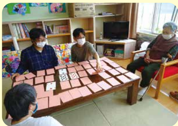
憩いのステーション 縁の木 ～ 頭を悩ませカードゲーム ～