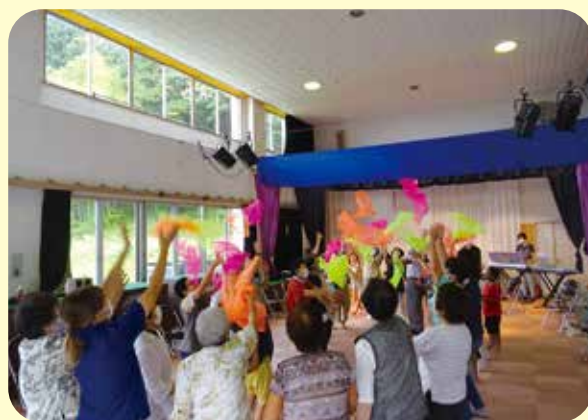
太美山サロン ～ 子どもから高齢者まで 多世代交流 ～